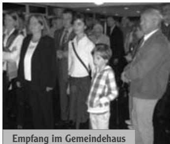
Empfang im Gemeindehaus

Sehr viele Menschen aus unserer Gemeinde, Gäste aus den Nachbargemeinden, Freunde und Bekannte von