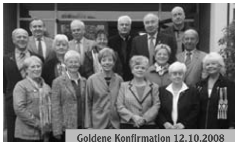
Goldene Konfirmation 12.10.2008