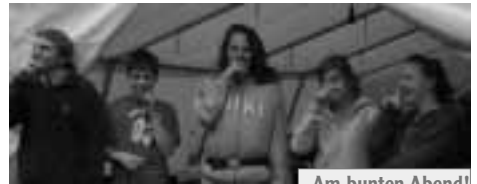
Am bunten Abend!

dass wir bei der lustigen Mini-Olympiade ins Schwitzen gerieten. Dieser sehr sportliche Tag wurde durch eine Vitaminbombe zum Mittag, die aus verschiedenen Salaten bestand und einem späteren Freibadbesuch abgerundet. Nach einem sportlichen Tag wurde am Abend unser Gehirn gefordert. Es war Zeit für das Tablequiz! Wir waren mit viel Ehrgeiz und leichter Überschätzung bei der Sache, sodass wir später feststellen mussten, dass manche von uns im Jahr überraschenderweise 2.300 kg Fleisch essen.