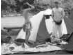
Wie soll das funktionieren?

Dort wartete bereits die nächste Aufgabe auf uns, der Zeltaufbau: Hier waren echte Teamarbeit und logisches Denken gefragt. Als alles geschafft war, ließen wir den Abend mit gemeinsamem Essen und gemütlicher Runde am Lagerfeuer ausklingen.