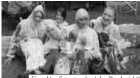
Ein echter Camper scheut den Dreck nicht!

Doch in der Nacht hieß es dann „Land unter“, denn ein heftiges Gewitter mit richtig viel Regen überraschte uns. Zelte älteren Baujahres konnten nur noch mit Abdeckplänen und Wäsche-