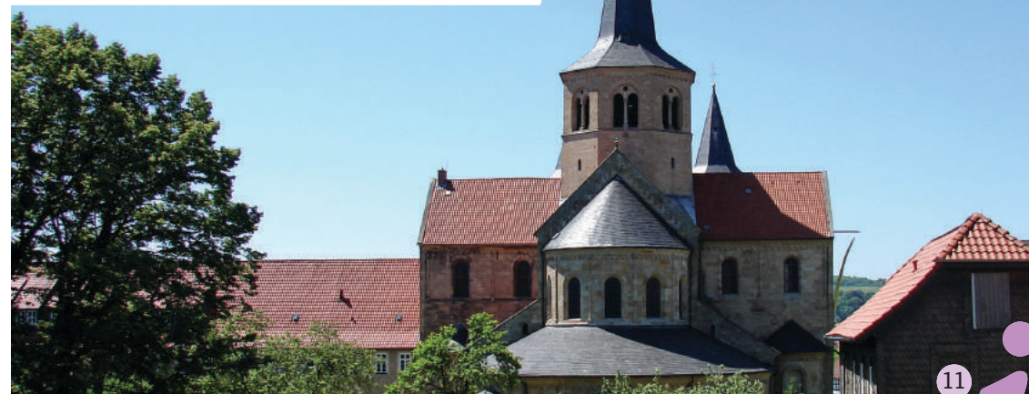
Die Godehard-Basilika ist Ziel des Ausflugs nach Hildesheim.