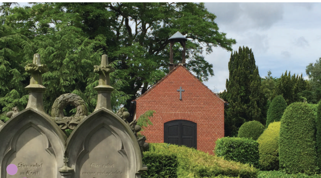
18 Im August bekommt der leere Glockenturm der Friedhofskapelle St. Johannis Bemerode eine neue Glocke.