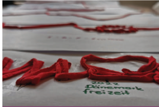
Rückblicke in Form eines roten Lebensfadens zeigen den bisherigen Lebensweg: Konfirmanzen im Februar 2023 auf der Eichenkreuzburg

Der unvergessliche Vorstellungsgottesdienst hatte großen Unterhaltungswert. Das Publikum – die Gemeinde – zeigte sich von dem Theaterstück und insbesondere vom Entscheidungsspiel beeindruckt. Beim Mitmach-Entscheidungsspiel musste jede und jeder in Form einer pinken oder blauen Karte "Farbe bekennen"!