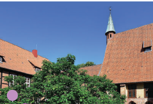
16 Kloster Isenhagen ist ein Ziel des Ausflugs 2023.